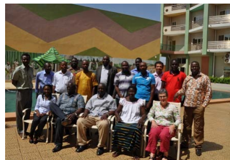
Figure 2 – Atelier de démarrage des consortia, Ouagadougou, Burkina Faso, octobre 2014

Les consortia ont développé leur concept note et un programme de travail destinés à affiner leurs propositions de recherche afin de mieux répondre aux opportunités de financement. Soit ils envisagent des activités de recherche au sein de leurs propres structures en s'appuyant sur les expertises de membres (Energie-Compost, 2015), soit ils établissent des partenariats économiques entre membres du même consortium (Energie-Compost et Cosmétiques, 2015), soit encore avec l'appui du coordinateur PAEPARD, ils recherchent des partenaires européens pouvant assurer une expertise technique associée à un débouché commercial à terme (Energie-Compost et Cosmétiques, 2015 et 2016 – Figures 3-4).