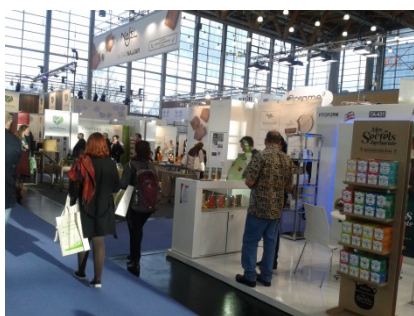
Figures 3-4 – Rencontres au salon européen Vivanes, Nuremberg, Allemagne, février 2016.

Les consortia ont développé leur concept note et un programme de travail destinés à affiner leurs propositions de recherche afin de mieux répondre aux opportunités de financement. Soit ils envisagent des activités de recherche au sein de leurs propres structures en s'appuyant sur les expertises de membres (Energie-Compost, 2015), soit ils établissent des partenariats économiques entre membres du même consortium (Energie-Compost et Cosmétiques, 2015), soit encore avec l'appui du coordinateur PAEPARD, ils recherchent des partenaires européens pouvant assurer une expertise technique associée à un débouché commercial à terme (Energie-Compost et Cosmétiques, 2015 et 2016 – Figures 3-4).