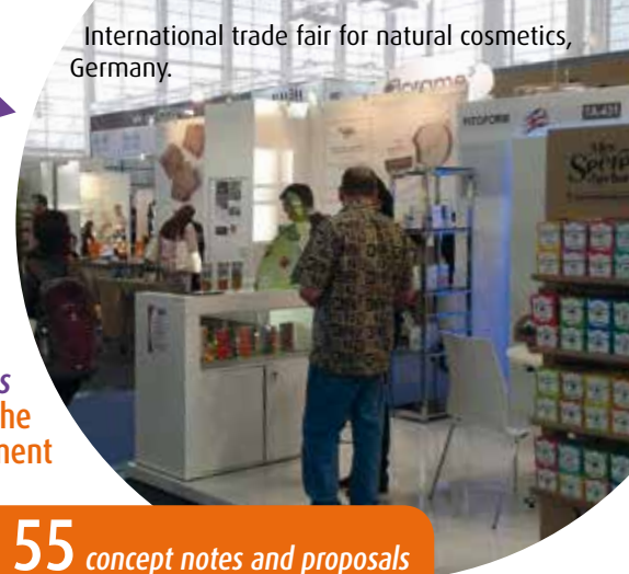
International trade fair for natural cosmetics, Germany.

Translation into research proposal and sustainable fund sourcing Traduction sous la forme de projets de recherche et pérennisation du financement