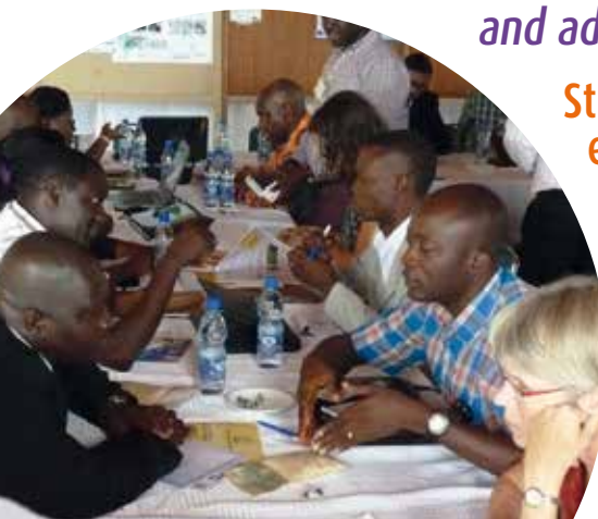
Multi-donor workshop in Entebbe, Uganda.

Identification of the needs in communication and capacity for strengthening and sustaining the partnerships Identification des besoins en communication et formation pour renforcer et pérenniser les partenariats