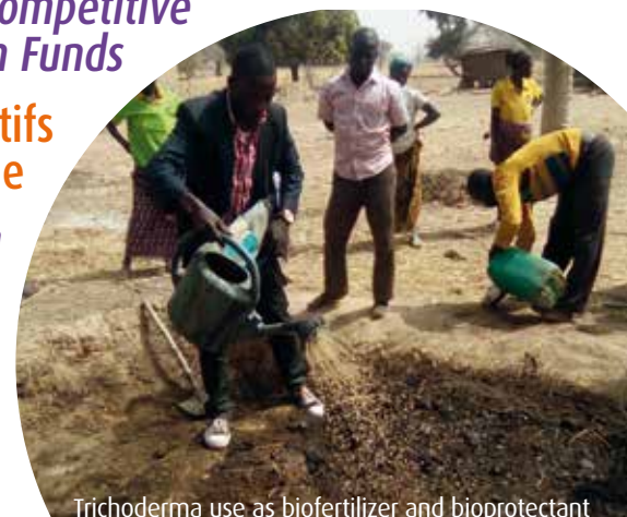
Trichoderma use as biofertilizer and bioprotectant in Burkina Faso.